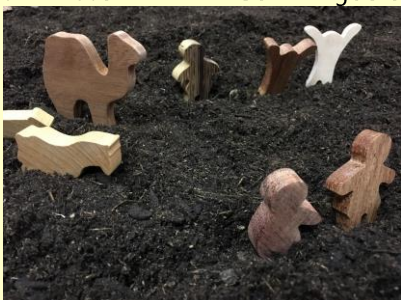
Godly-Play Materialien. Hier: Hiob und seine Familie

Anmeldungen bitte umgehend an das RPZ St. Ingbert.