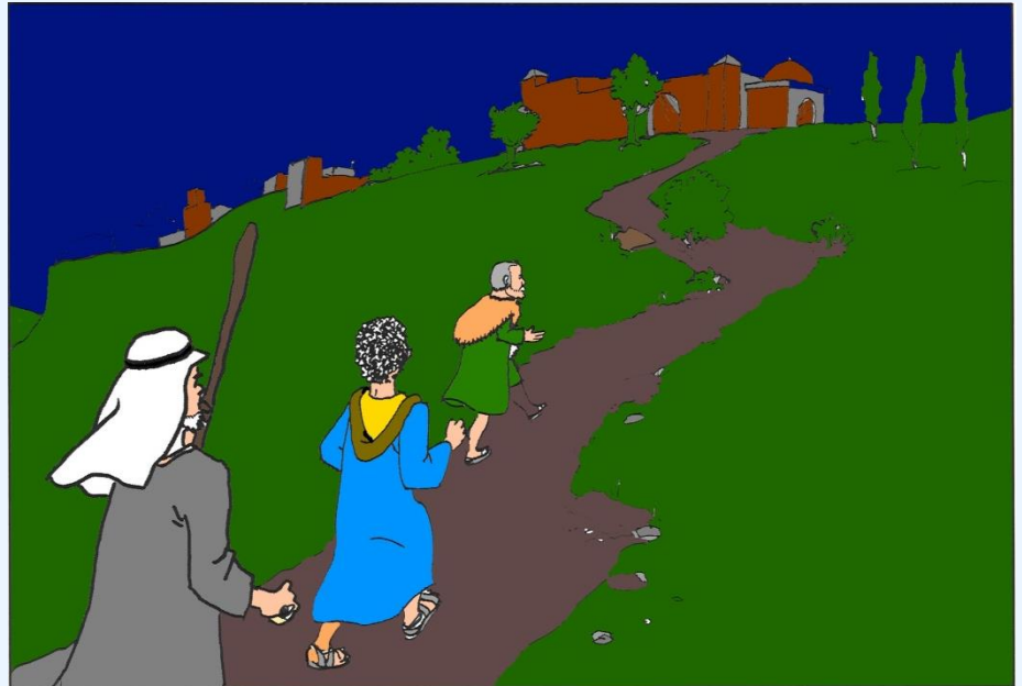
Die Hirten eilen nach Betlehem, um die Geschichte zu sehen, die da geschehen war. (nach Lk 2,15-16) Bild: RPZ St. Ingbert unter Verwendung einer Zeichnung von Christian Günther

Religionsunterricht mit dem neuen Lehrplan Gymnasium Theologisches & Unterrichts- praktisches zum Lernbereich 4 . In Kooperation mit LPK und LFK und Ev. Schulreferat. Infos auf religionsunterricht-pfalz.de