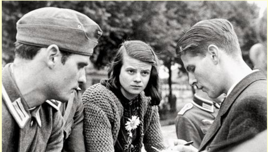
The White Rose by jimforest is licensed under CC BY-NC-ND 2.0 via Flickr

„Von Politik verstehe ich nicht viel. Ich bin aber in der Lage, zwischen Recht und Unrecht zu unterscheiden.“